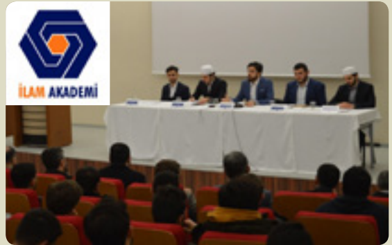
"İletişim Çağında İnsan" paneli, İlam Akademi öğrencileri

İLAM Akademi'de sunulan diğer imkânlar, eğitmen kadrosu ve kayıt şartları için detaylı bilgi www.illam.org.tr adresinden alınabilir.