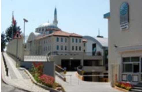
Aziz Mahmud Hüdayi Mah. Aziz Mahmud Efendi Sok. Camii İçi No:1 Üsküdar–İstanbul 0216 341 05 97